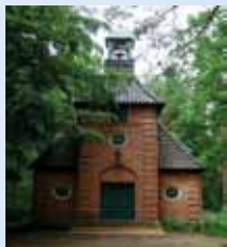
Waldkapelle Berlin-Hessenwinkel Waldstraße, Bus 161