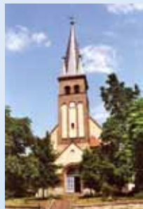
Dorfkirche Berlin-Rahnsdorf Dorfstraße Bus 161 (ca. 15 min Fußweg)