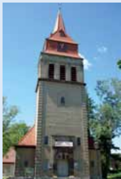
Taborkirche Berlin-Wilhelmshagen Schönblicker Straße S-Bahn Wilhelmshagen, Bus 161